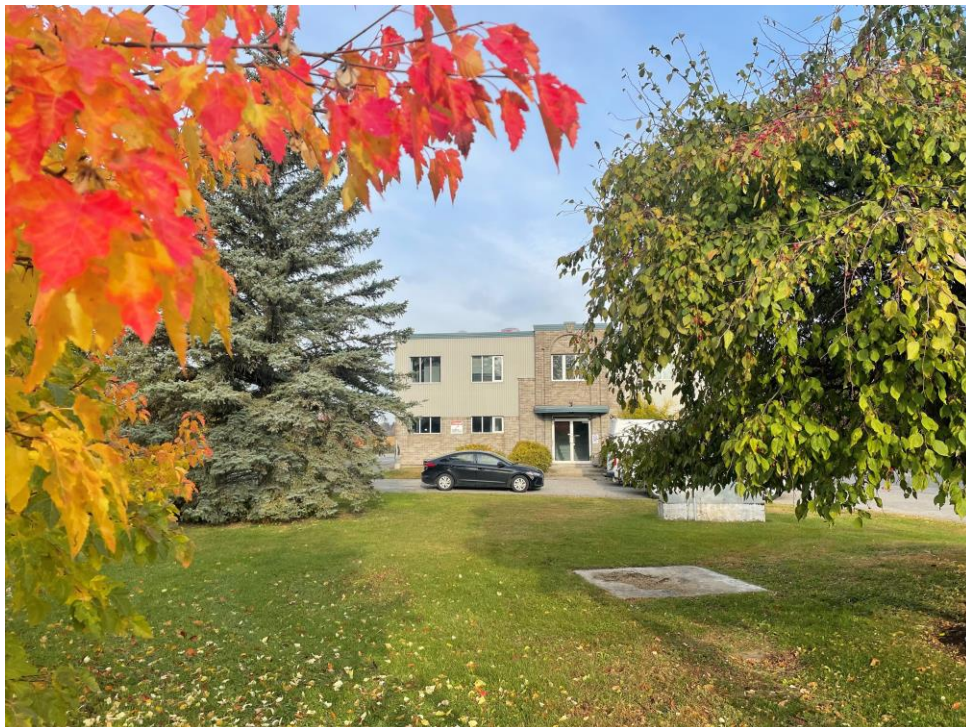
Usine de filtration et distribution d'eau potable de la Ville

Le gouvernement provincial a également demandé aux municipalités du Québec d'élaborer un plan municipal de réduction du plomb dans l'eau potable, en suivant les recommandations de Santé Canada. Le plan de la Ville de L'Épiphanie est donc détaillé dans le présent document.