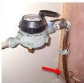
Tuyau en cuivre