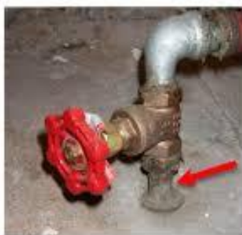
Tuyau en plomb

Comme la plomberie ou les équipements de plomberie peuvent contenir du plomb, un plombier peut faire un examen visuel de la plomberie de la maison concernée par des dépassements en plomb, à la demande et aux frais du propriétaire. Ce dernier rendra compte de ses conclusions et observations à la Ville également. Advenant la découverte d'éléments comportant du plomb du côté privé, le propriétaire de la maison a la responsabilité d'effectuer les travaux à ses frais.